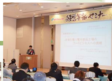
経営革新セミナー

また秋には「経営革新セミナー」を行っており、様々なジャンルで主に経営に役立つ講演会を開催しております。どちらも大変ご好評いただいている事業です。