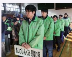
これからも地域の安全に努めます

当組合は平成16年7月に、会津若松警察署との間で「安全で安心な街づくり」のための通報連絡等、支援活動に関する覚書を締結し、会津若松市内10店舗の渉外係で編成する防犯ボランティア組織「あいづしんくみ見廻り隊」を結成しました。