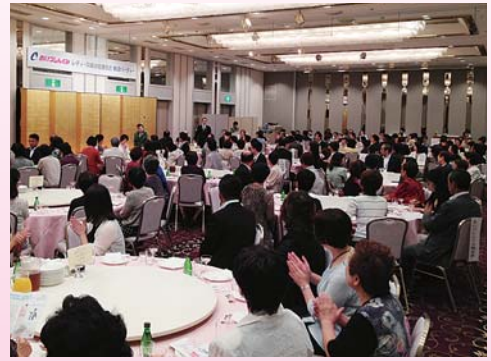
レディース城の会 納涼パーティー