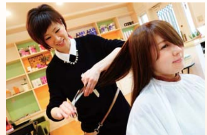
専門家からカラーコーディネートについてのアドバイスを受けた美容室の例