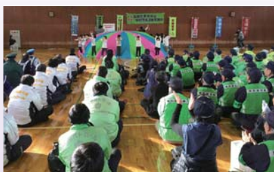
特別警戒活動出動式の様子