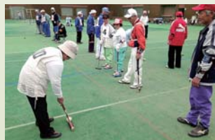
ゲートボール大会