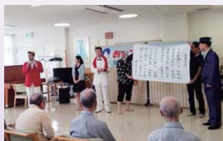
芸能部訪問ボランティア