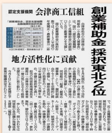
(平成27年1月23日 福島民友新聞掲載)