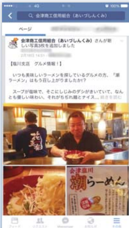
あいづしんくみ Facebookページ

当組合では、お取引きいただいている事業所へのサービスとして、事業所の事業内容、新商品情報、イベント・催し物情報等を、当組合が運営している「あいづしんくみFacebookページ」から無料でPR・宣伝することができます。お取引きいただいている事業所の活性化のため、金融面のサポートはもちろん、情報面でのPRサポートも行っています。