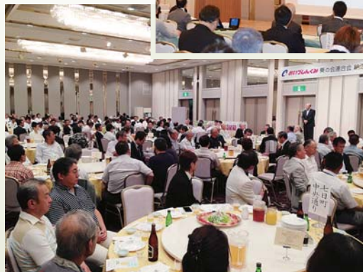
納涼ビア・パーティー