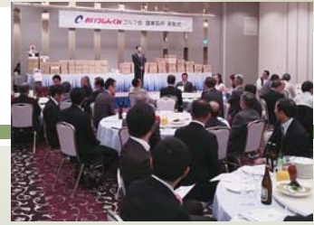
あいづしんくみゴルフ会表彰式

ゴルフ会では年3回ゴルフコンペを開催しており、第3回コンペは「あいづしんくみ理事長杯」として盛大に開催しています。ゴルフを通じて参加者同士の親睦・交流を図っています。