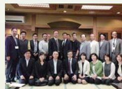
日帰り研修視察旅行